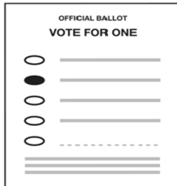
Vote por el número permitido