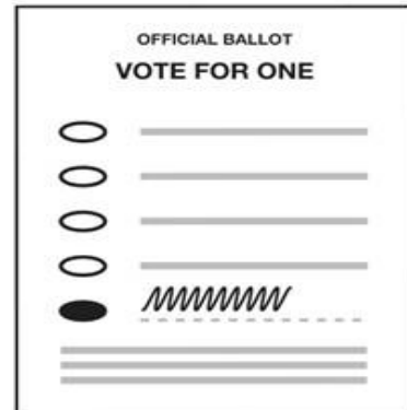
Siempre oscurezca la caja, incluso en el voto por escrito