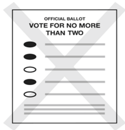
No vote por demás

Si llega a estropear su papeleta y desea que se le envíe otra, coloque el voto nulo en el sobre de envío e inmediatamente envíelo a la Oficina del Secretario del Condado de Sierra. Asegúrese de marcar la casilla marcada "Spoiled" (Estropeado) en el sobre de retorno y firme su nombre en el espacio proporcionado. Para votar por un candidato calificado por escrito, escriba su nombre en la línea en blanco al final de la lista de los candidatos. Luego oscurezca el óvalo ubicado al lado del nombre. Una lista de los candidatos calificados por escrito estará disponible en la Oficina del Secretario del Condado de Sierra, y en el Centro de la Tercera Edad de Loyalton el Día de las Elecciones. La lista se publicará en nuestro sitio web en www.sierracounty.ca.gov el 13 de marzo del 2019.